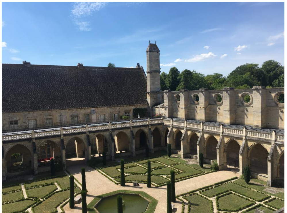
La vue depuis les chambres qui ont accueilli les participants de la Summer School