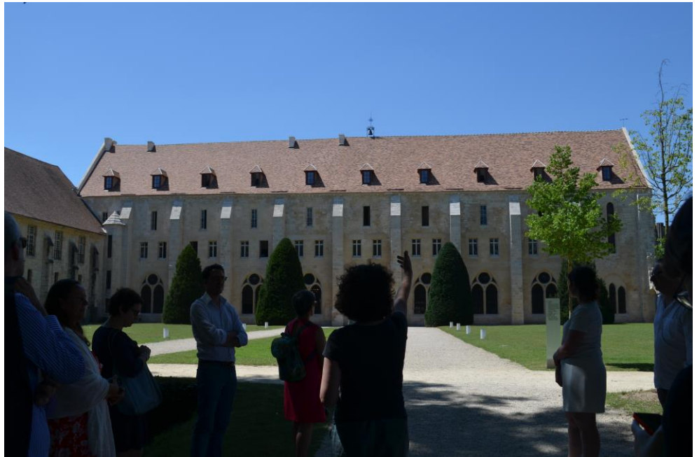
Visite-conférence : « L'abbaye de Royaumont, le site, les collections, et les archives »