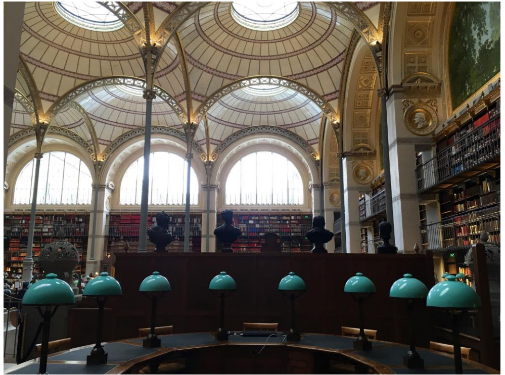
Visite du site Richelieu, Bibliothèque nationale de France, salle Labrouste